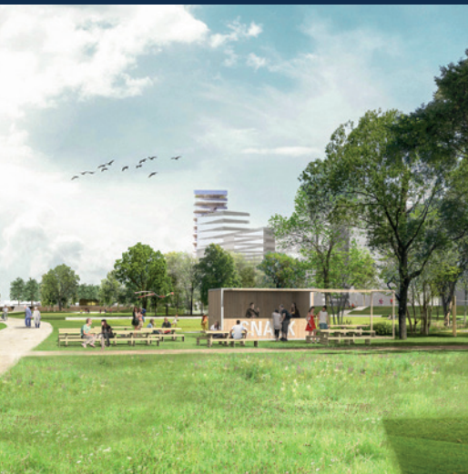
© PIHHL/ Reichen et Robert & Associés/Atelier Jacqueline Osty & Associés