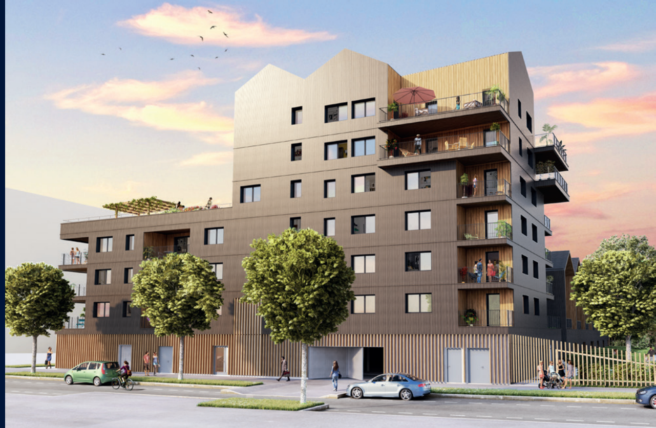
T4 duplex - Terrasse d'exception de 85 m 2

La Dame de Baud c'est aussi 9 maisons et 1 appartement T4 éligibles au dispositif d'accèsion maîtrisée (1) . Les aménagements intérieurs sont optimisés afin d'accueillir une famille. Les maisons disposent d'un jardin exposé sud et l'appartement d'une belle terrasse plein ouest.